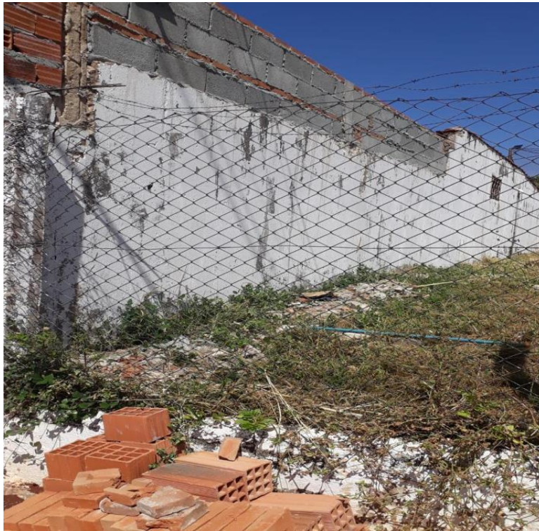
Muro da residência/ terreno da prefeitura