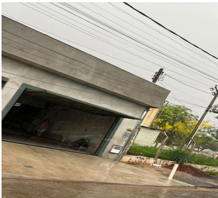
Frente da casa ao lado do terreno

Um suposto vazamento infiltra o muro da casa, provocando danos e solturas no piso da varanda, garagem, pois o muro que separa a casa do terreno é da proprietária da casa.